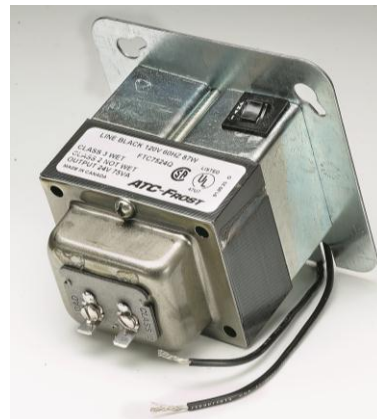
节能认证2类变压器