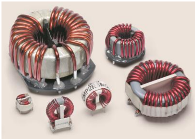
隔离和噪音抑制电感和扼流圈