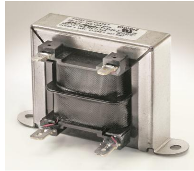
槽式安装变压器, 其绝缘绕组和引脚通过机构认证